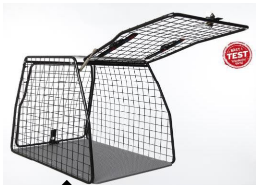
Artfex Hundbur Large art nr 10003